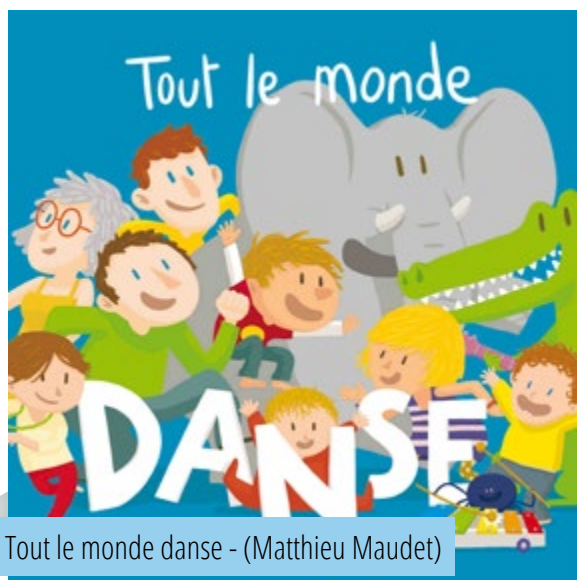
Tout le monde danse - (Matthieu Maudet)

https://www.youtube.com/shorts/ rWvjKkYqjUc