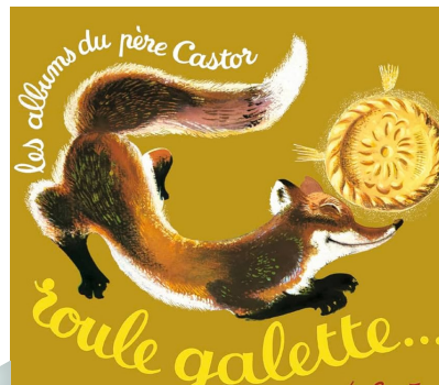
Roule Galette (Les Albums du Père Castor)

Une histoire en randonnée autour de la réalisation d'une galette.