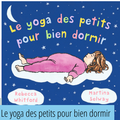
Le yoga des petits pour bien dormir (R. Whitford, M. Selway)

«Petit yogi met la tête à l'envers comme une chauve-souris... Petit yogi cligne des yeux comme un hibou... Petit yogi s'étire pour sentir l'air de la nuit comme un renard...»