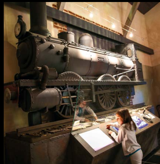
Locomotive à vapeur interactive

L'histoire de cette gare n'aura bientôt plus de secrets pour vous ! Un moment authentique et d'initiation à la découverte des cheminots et du monde ferroviaire.