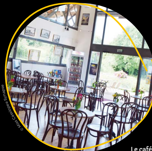
Le café De la gare