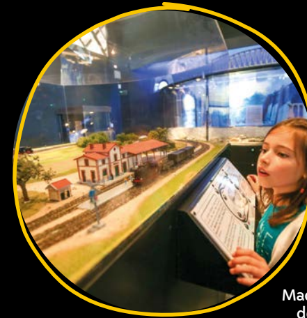
Maquette de train